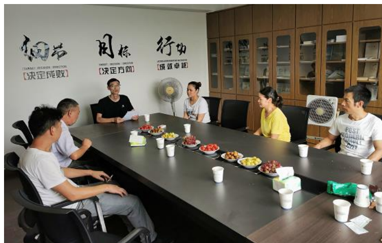
图 3.2-1 培训活动

公司将员工学习和发展视为“投资”，把创建学习型组织，营造全员学习的氛围作为公司长期发展战略的重要组成部分。随着公司规模扩大和全球化发展战略的实施，根据企业相关规定及各部门要求确定培训人员的需求情况。各部门负责人确定人员培训需求后经公司领导审批，相关部门每季度根据人员数量酌情进行培训计划的制定与实施。公司并成立了“欧赛亿如商学院”，见图 3.2-1 所示。