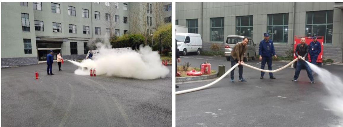
图 6.3-01 应急医疗救护演练现场

公司每年举行消防演练和各种灾害应急演练。公司制订了《配电房火灾、爆炸应急预案》等应急预案、《触电事件应急预案》、《重大设备故障应急预案》等应急处置方案等，对火灾、机械、触电等均有相应的应急措施，并成立了应急指挥中心和应急救援专业组。