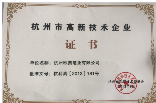
表3.3-2 公司诚信经营的成果

公司高层遵循“人无信不立，厂无信不存”的诚信共赢思想，从组织结构设计、工作流程优化、规章制度完善等方面为公司守法诚信经营创造了一个良好的环境，并在日常工作中带头践行。公司被授予杭州市高新技术企业、社会责任建设 C 级企业奖、十佳笔业功勋、桐庐制笔行业优秀会员企业奖等荣誉，如图 3.3-1 所示：